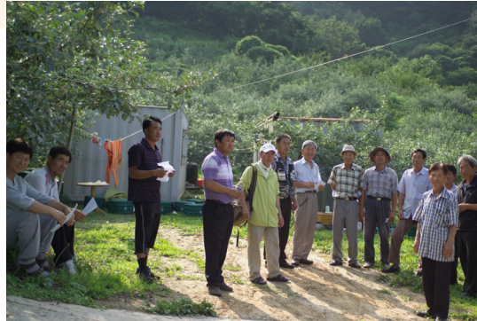
무농약·유기농과수 전문가 과정(2010년)